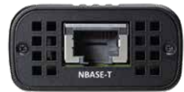
NBASE-T Ethernet Port View