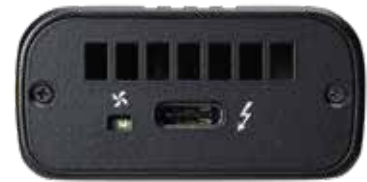
Thunderbolt™3 Port View